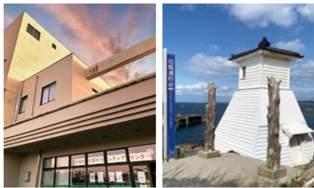
志賀町災害ボランティアセンター 旧福浦灯台 (志賀町)

北海道・東北ブロックの一員として4月30日から5日間、当会職員を1名派遣いたしました。志賀町は輪島市の南部に位置し、震度7を観測した地域です。現地では要配慮者の確認をするため戸別訪問を行いました。