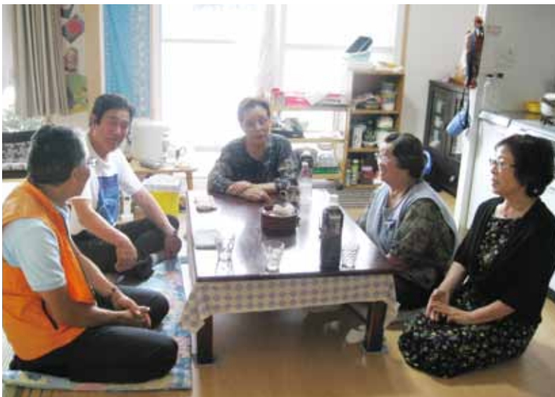
お宅にお邪魔したり