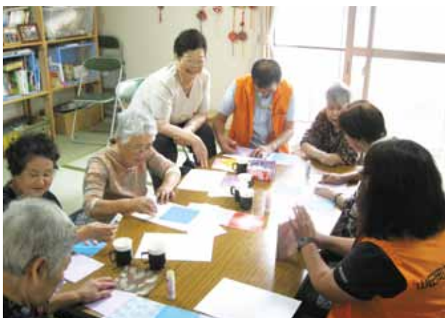
よりあっこでうちわ作り

毎月仮設・在宅などを 訪問し、お茶っこ飲みや 物作り、いろいろしてま すので皆さんおでんせ！