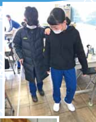
白杖体験 (視覚障がい者体験)