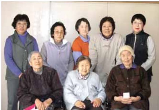
馬指野シスターズです♪