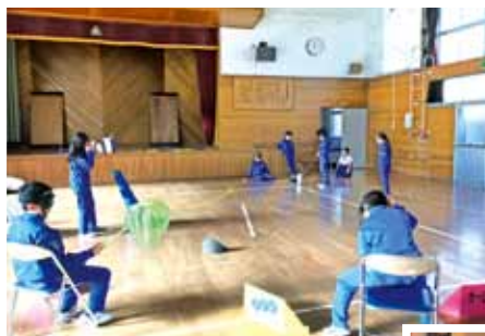
レクリエーション (視覚障がい者体験)