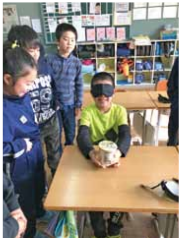
アイマスク体験 (視覚障がい者体験)